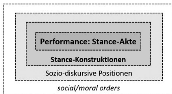
Abb. 2: Miteinander verknüpfte Ebenen der Stance-Praxis (eigene Darstellung)

In der Positionierungspraxis zeichnen sich lexikogrammatistische Muster ab, die entscheidende Funktionen des Stancetaking übernehmen und ferner typisch für die Stance-Praxis sind. Angesprochen sind damit sogenannte Stance-Konstruktionen als sprachliche Form-Funktionskopplungen, die durch den wiederkehrenden Gebrauch in Positionierungszusammenhängen mit der Stance-Praxis sowie mit bestimmten soziodiskursiven Positionen assoziiert sind (vgl. Schmid 2014). Mit Heiko Hausendorf können soziale bzw. soziodiskursive Positionen „als Verfestigungen und Erstarrungen kommunikativer Erwartungen [...] [begriffen werden], die sich losgelöst von Personen aus Fleisch und Blut („Akteuren“) kommunikativ verselbstständigt haben und unterschiedliche Formen sozialer Kategorisierung annehmen können“ (Hausendorf 2012: 102). Infolge dieser Entkopplung von konkreten Akteur:innen werden die entsprechenden Verfestigungen zu kollektiv geteilten Stance-Ressourcen, derer sich potenziell jede:r bedienen kann. Das Beanspruchen jener kommunikativ aufgeladenen Sprachmittel (Stance-Konstruktionen) in der Praxis kann mit dem Einnehmen der damit assoziierten Positionen gleichgesetzt werden (vgl. Tab. 2). Wer auf diese geprägten Verfestigungen (vgl. Feilke 1996) zurückgreift, ruft den damit verknüpften situativen Stance-Kontext und korrespon-