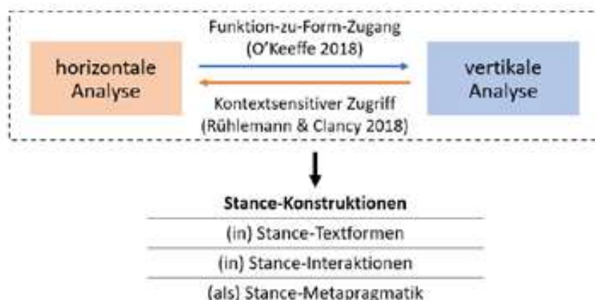
Abb. 4: Methodologie einer konstruktionsgrammatischen Horizontal-vertikal-Analyse (eigene Darstellung)

Im Framework der Social Construction Grammar verortet, beleuchtet der vorliegende Beitrag nicht nur theoretische Bestimmungsstücke der konstruktionsgrammatischen Stance-Forschung, sondern gibt auch korpusbasiert Einblick in die Verschränkung verschiedener Untersuchungsebenen. Vielfach konnte dabei das Potenzial einer umfassenden Analyse nur angedeutet werden, unterschiedliche Vertiefungen – etwa im Hinblick auf die interaktiv-sequenzielle Dimension des Positionierens – bieten sich an.